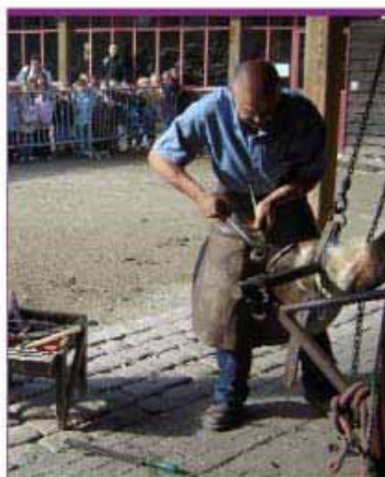
Avec son savoir faire et sa passion du métier, le maréchal fessant du haras d'Hennebont a connu beaucoup de succès lors des sorties scolaires organisées du Haras les 19 et 21 juin pour les écoles primaires du Pays de Lorient

C'est d'Angleterre qu'est venue la légende de Saint Dunstan, un forgeron nommé archevêque de Canterbury en 959. Le diable lui ayant amené son cheval à ferrer, Dunstan cloua le fer sur le pied fourchu du démon. Celui-ci dut promettre, afin d'être libéré, de ne jamais entrer dans une maison protégée par un fer à cheval.